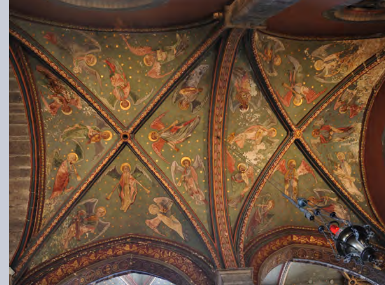
19 Musicerend engelenkoor tegen een hemelse achtergrond, oude schilderij (1405) door J. Helbig gerestaureerd