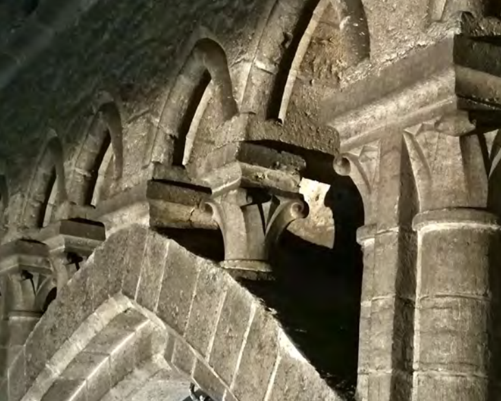
11 Details van zuilenkapitelen