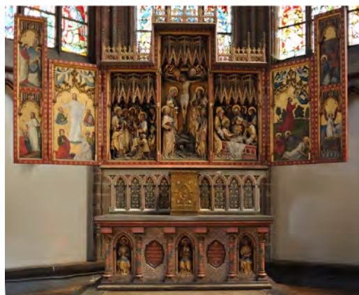
13 Retabel met panelen die tafereeltjes uit het leven van Saint-Jacques le Majeur voorstellen

Om in contact te treden met 'Les amis de l'église Saint-Jacques de Tournai': info@saint-jacques-tournai.be